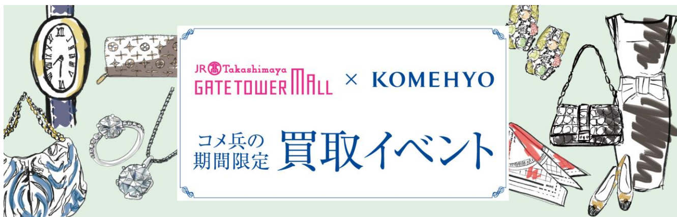
「タカシマヤ ゲートタワーモール×コメ兵 期間限定買取イベント」イメージ

イベントでは、買取成立・不成立にかかわらず買取査定をご利用いただいたお客様に、タカシマヤ ゲートタワーモールでのお買物が500円OFFとなるクーポン券、同施設内のカフェでドリンクを楽しめるチケットを各1枚プレゼントいたします。