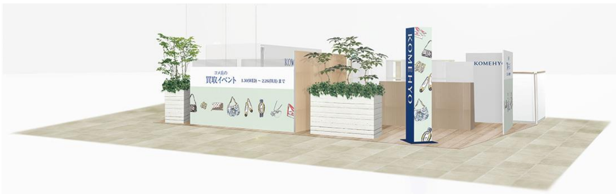
特設会場イメージ